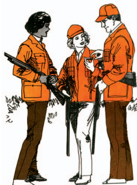
• Ο χειρισμός της κάνης του όπλου έχει ιδιαίτερη σημασία

Τα πυρομαχικά φυλάσσονται και αυτά σε κλειδωμένο ερμάριο, χωριστά από τα όπλα. Καλό είναι τα όπλα να μη φυλάσσονται μέσα σε θήκη, γιατί πολλές φορές οι θήκες εγκλωβίζουν υγρασία και αναπτύσσονται ανεπιθύμητες οξειδώσεις. Σε καμία περίπτωση δεν επιτρέπεται να αποτελούν παιχνίδι των παιδιών.