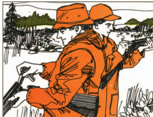
Σημαδεύετε προς μια ασφαλή κατεύθυνση κατά το γέμισμα του όπλου

Τρόποι κρατήματος όπλου όταν βρισκόμαστε απέναντι από κάποιον